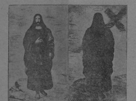
El Cristo visto con luz. El Cristo visto sin luz. NOTA.—Léase lo que publicamos ayer acerca de este extraño fenómeno.